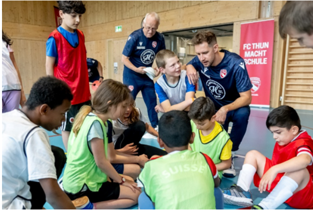
Abbildung 6: Foto des FC Thuns von seiner Aktion "FC Thun macht Schule"