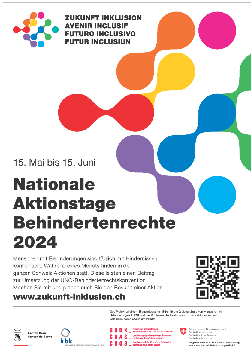
Plakat zu den Nationalen Aktionstagen Behindertenrechte 2024