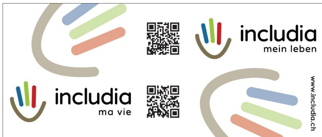
Abbildung 3: includia.ch Beachflag