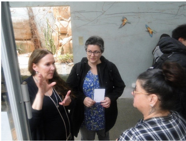
Abbildungen 7: Human Library im Museum für Kommunikation

Am 12. Juni haben das AIS und die kbc zusammen eine kantonale Abschlussveranstaltung organisiert. Unter anderem aufgrund der grossen Zahl an Aktionen, der sowohl thematisch als auch regionalen breiten Abdeckung des Angebots und der gelungenen Abschlussveranstaltung, darf das Projekt als Erfolg bewertet werden.