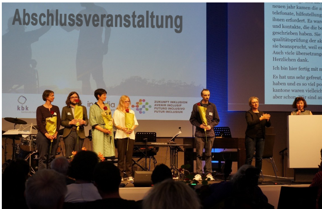
Abbildung 8: Kantonale Abschlussveranstaltung der Aktionstage Behindertenrechte