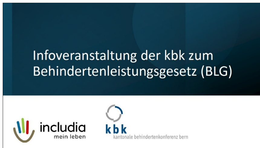
Abbildung 4: Aus Präsentation zum BLG

Im Auftrag des Kantons Bern hat die kbk Informationsveranstaltungen zum BLG durchgeführt. Mit Veranstaltungen in deutscher und französischer Sprache, in einfacher Sprache, mit Gebärdensprachdolmetschung und Veranstaltungsorten in verschiedenen Regionen des Kantons hatte die kbk das Ziel, vor allem privatwohnende Menschen mit unterschiedlichen Bedürfnissen zu erreichen. Die kbk kontaktierte und besuchte gezielt Freizeittreffs und Vereine von Menschen mit Behinderungen. Einige Veranstaltungen wurden zudem für Fachpersonen durchgeführt.