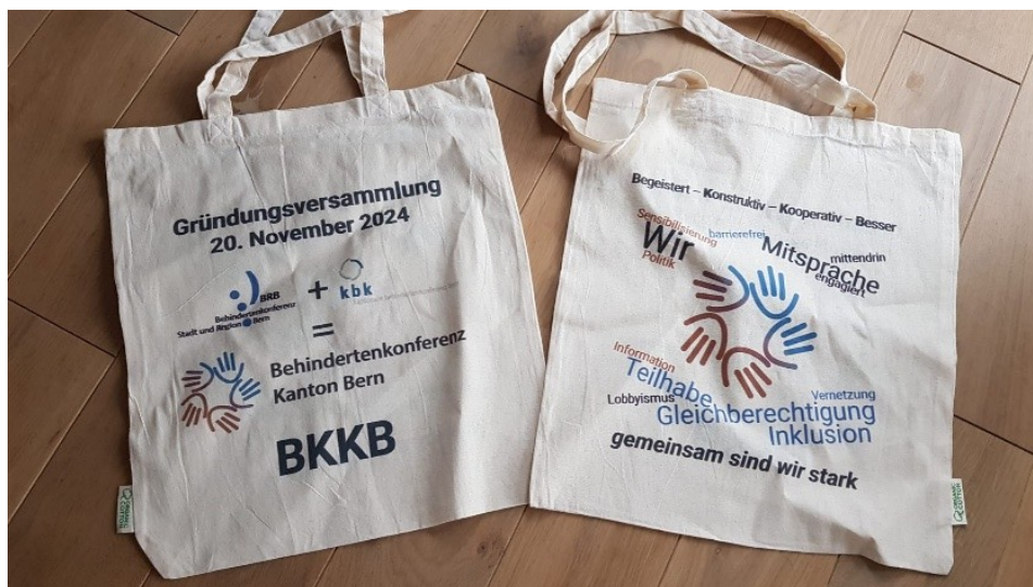
Abbildung 1: BKKB-Einkaufstaschen aus Stoff

Am 20. November 2024 war es so weit: Nachdem sowohl die Mitglieder der kbk (4. September 2024) wie auch die Mitglieder der BRB (17. September 2024) der Fusion zugestimmt haben, wurde mit der erfolgreichen Gründungsversammlung der neuen, zusammengelegten Behindertenkonferenz das formale Ende der kbk definitiv besiegelt. Damit endete eine knapp zwei Jahre dauernde Phase der Suche nach einer Zukunft, einer Neuausrichtung und Vorbereitung der Fusion. Die kbk ging per 1. Januar 2025 in die neu gegründete Behindertenkonferenz Kanton Bern (BKKB) über.